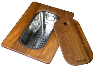
Tagliere Twin in legno Iroko con vaschetta scolapasta in acciaio inox 8644 044